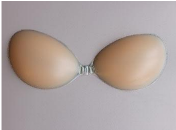
Foto: Beispiel für einen Klebe-BH mit Silikon-Cups